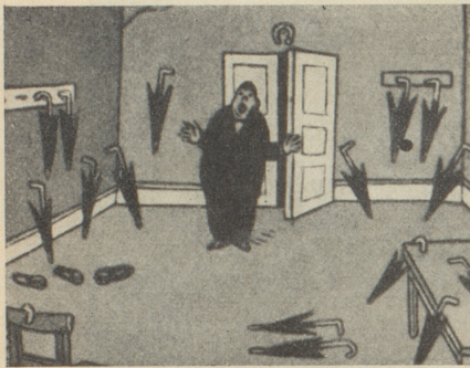
Nach der großen „Kaspar“ Professoren-Konferenz