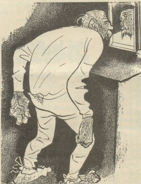
3. Der Hintermoser trägt keine SUN , weil ihm seine baumwollene Unterhose besser gefällt.