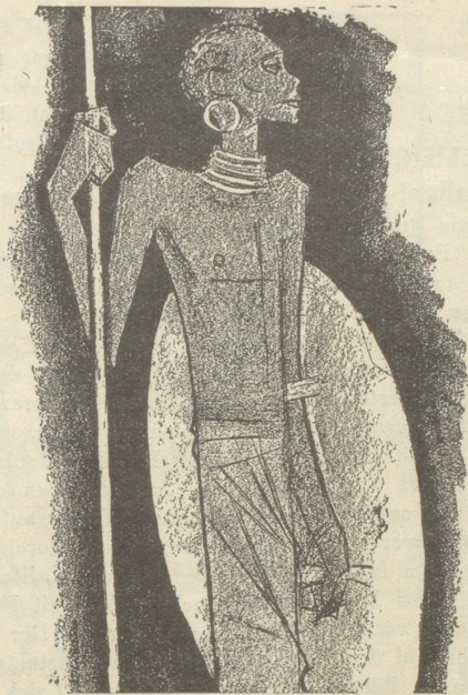
1. Der Zulu trägt keine SUN , weil er sie nicht braucht.