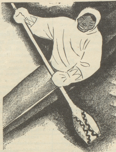
2. Der Eskimo trägt keine SUN , weil er sie nicht kennt.