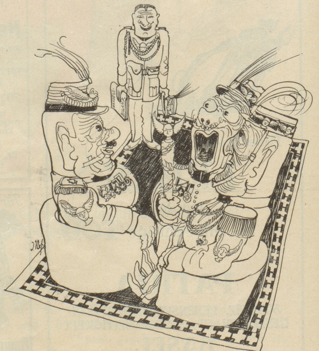
Im Generalplanwirtschaftsrat: «Wenn das Ausland nicht kaufen will, machen wir mobil.»