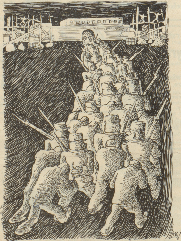
Motto: Gebt dem Staate, was des Staates ist. Die zu wenig geliefert haben!