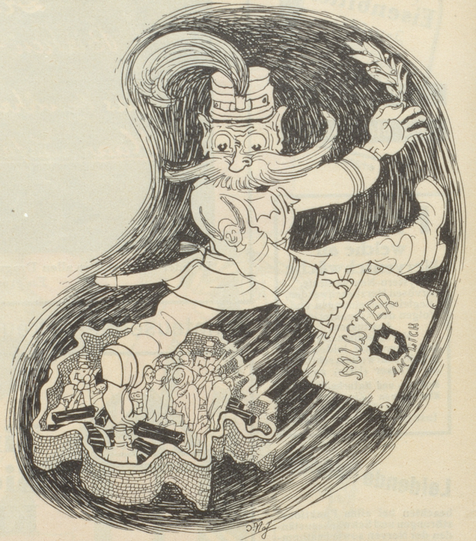
Export: «Ich will es Euch beweisen, dass der Staatspolizist besser verkaufen kann. Die Kaufleute sollen daheimbleiben!» —