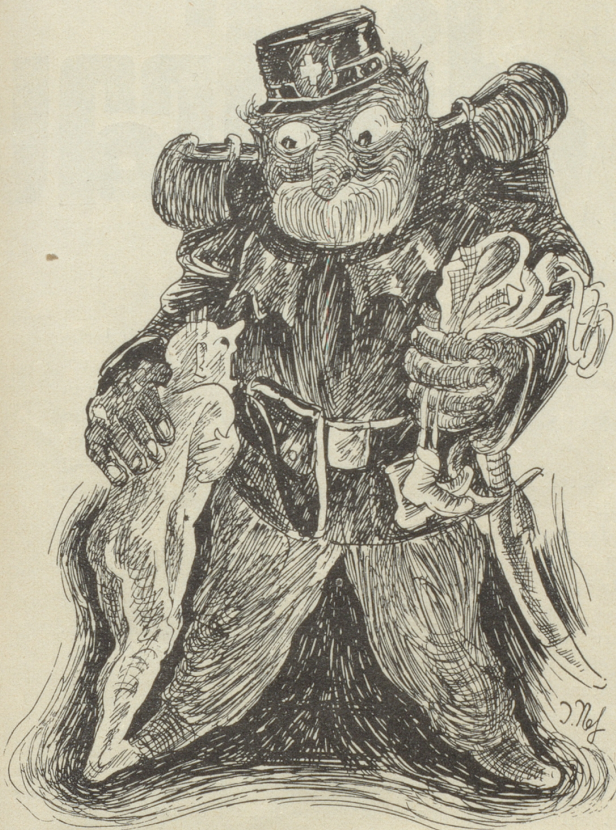
Privateigentum: «Jo weischt Chline, 's ischt em ringschte, wenn me n ü n t het — me muess denn kei Angscht ha, öppis z'verlüre!»