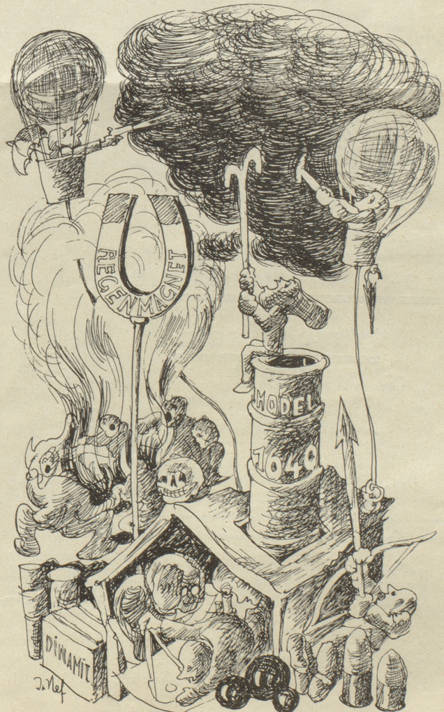
Die letzte Etappe: «So, jetzt wär alles schö planmässig, nu das chaibe Wätter will nid pariere!»