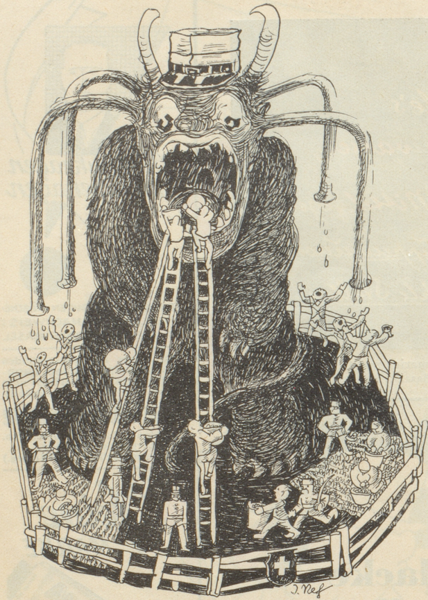
Der Staat als Produktenvermittler.