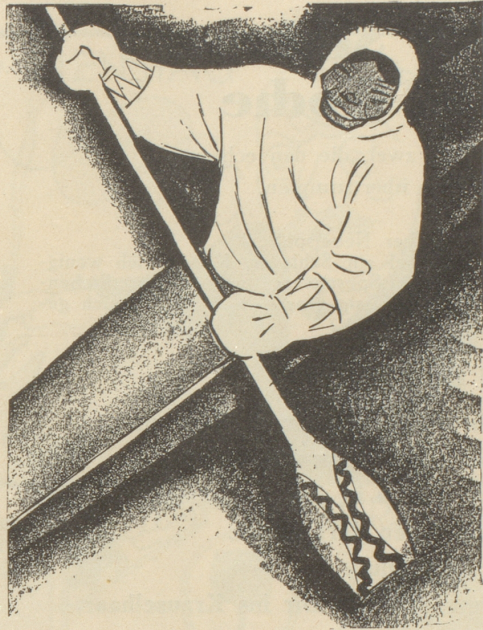
2. Der Eskimo trägt keine SUN , weil er sie nicht kennt.