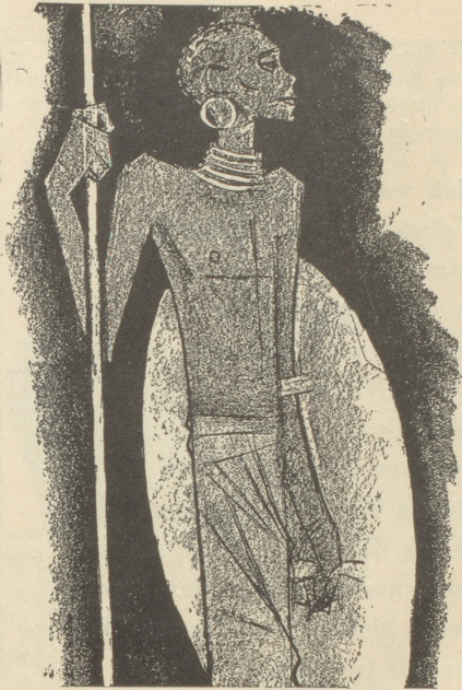
1. Der Zulu trägt keine SUN , weil er sie nicht braucht.