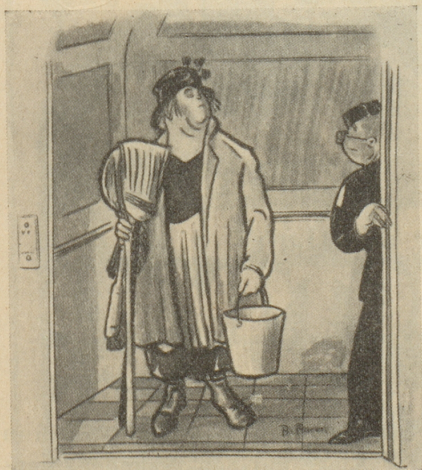
«Bitte ins Zimmer des Präsidenten!»