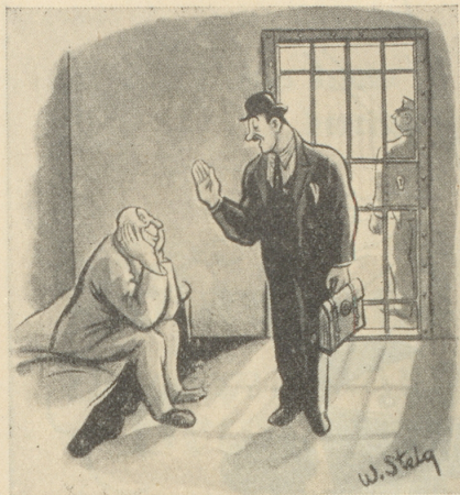
Der Anwalt: «Ihr Freispruch ist gesichert, Jim ... ich kann beweisen, dass Sie ein ganz minderwertiges Subjekt sind.» (Life)

Die Naive: «... aber ... das muss ja furchtbar unbequem sein!» Ata