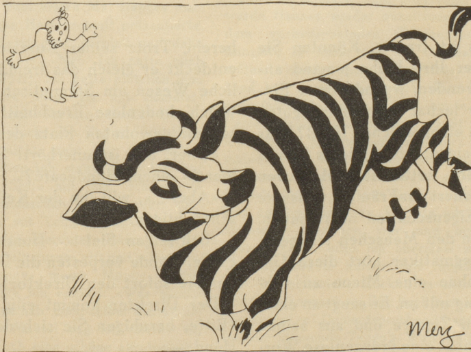
Bueb, hüt gömmer in Zoo..... und was weiter geschah.