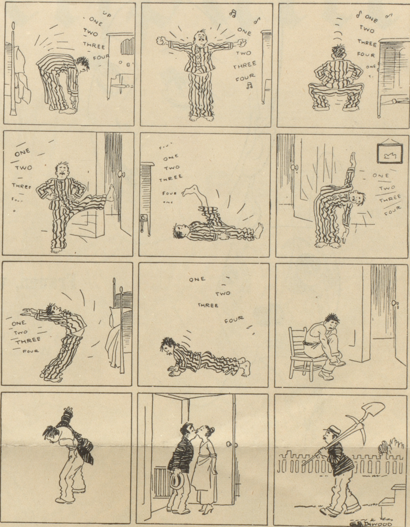
Er muss sich Bewegung machen.