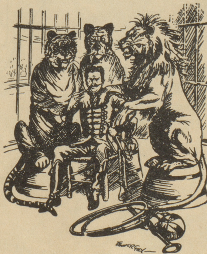
Löwenbändiger: «Ich bin neugierig, ob ich den Mut haben werde, den Chef nachher um eine Gehalts-Aufbesserung zu bitten.»