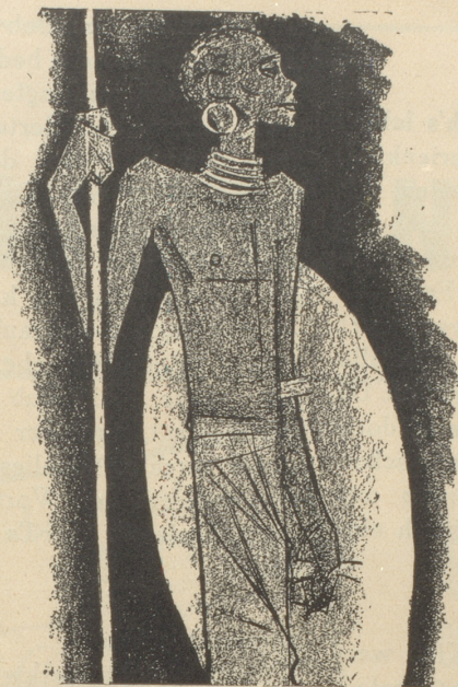
1. Der Zulu trägt keine SUN , weil er sie nicht braucht.