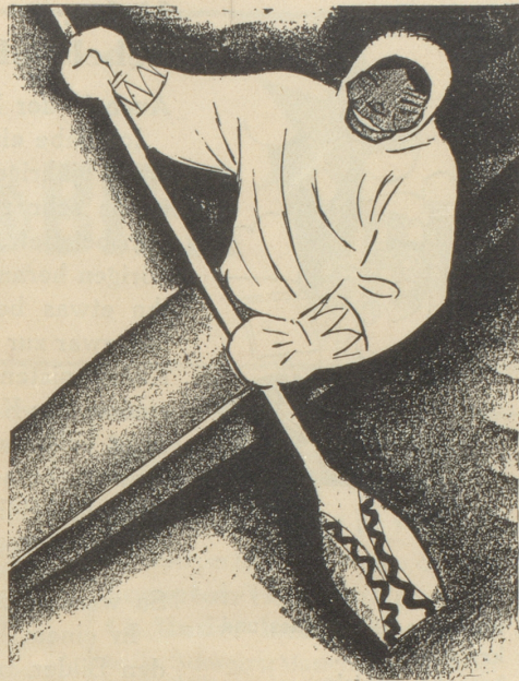
2. Der Eskimo trägt keine SUN , weil er sie nicht kennt.