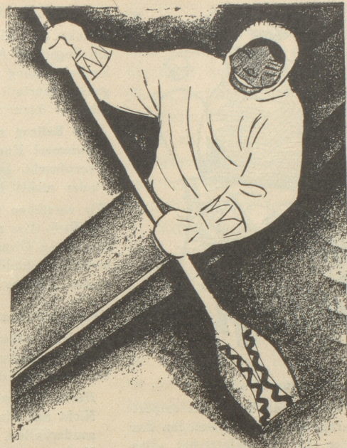
2. Der Eskimo trägt keine SUN , weil er sie nicht kennt.