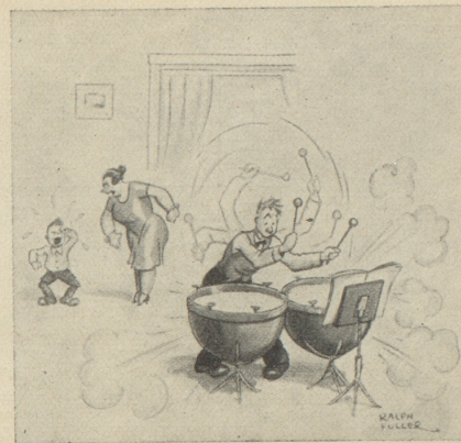
„Kurtchen! Willst du wohl ruhig sein, wenn Papa übt!“ Judge