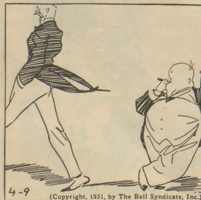
(Copyright, 1931, by The Bell Syndicate, Inc.)