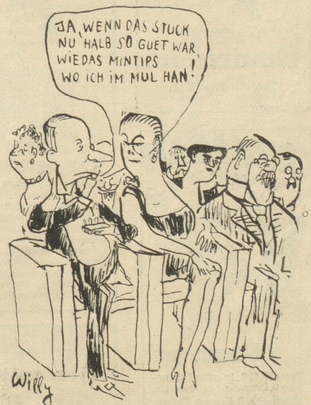
Die neuen, köstlichen Erfrischungs-Bonbons Mintips sind erhältlich in eleg. Etui zu 20 Cts. und offen nach Gewicht.