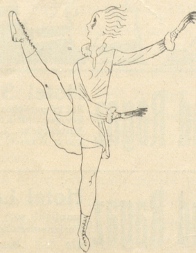
IV. Preis Ida Herzig, Rheineck

Die Lösungen 5—10 weisen zwar keine anatomischen, dafür aber kleine Gleichgewichtsfehler auf.