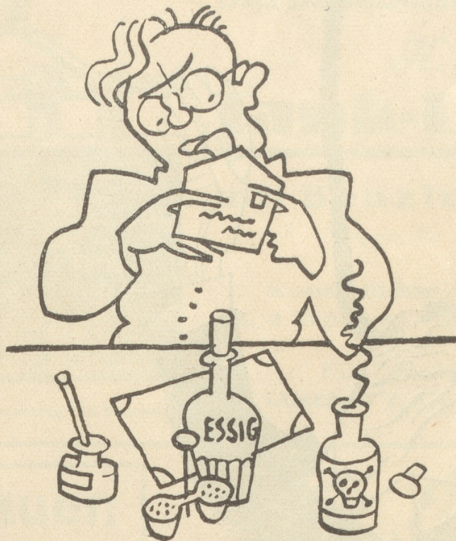
Beim heiligen Sankt Florian! Ein Artikel scharf und blutig! Ein Volltreffer in unseren Theater-tempel hinein. Ha-ha!