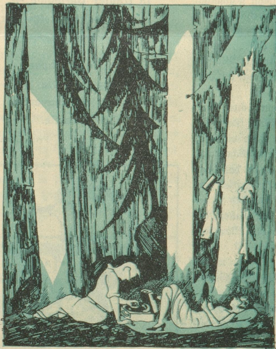
Die Rueh, die Stilli — — las ein laufe.