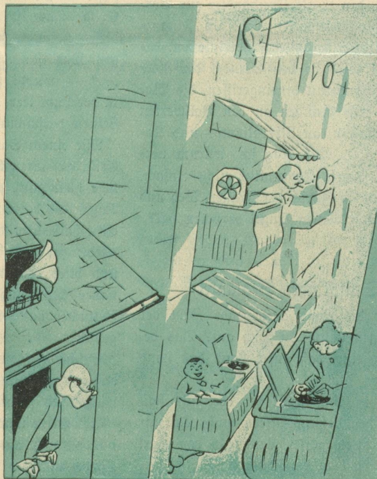
Ja, mer händ jez au ein — — mer lönd en grad laufe.