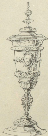
Und wenn der Becher aus Mailand stammt