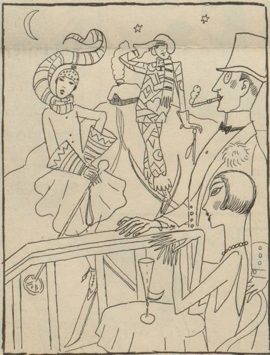
eine Sport- und Modezeitschrift sieht