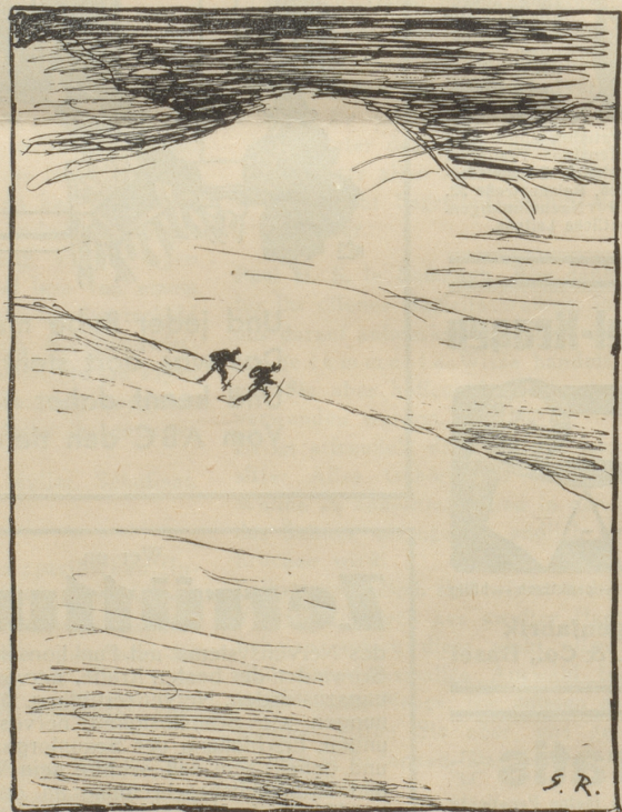
und wie er in Wirklichkeit aussieht.

Die L. N. R. schreiben unter Offiziersbeförderungen: