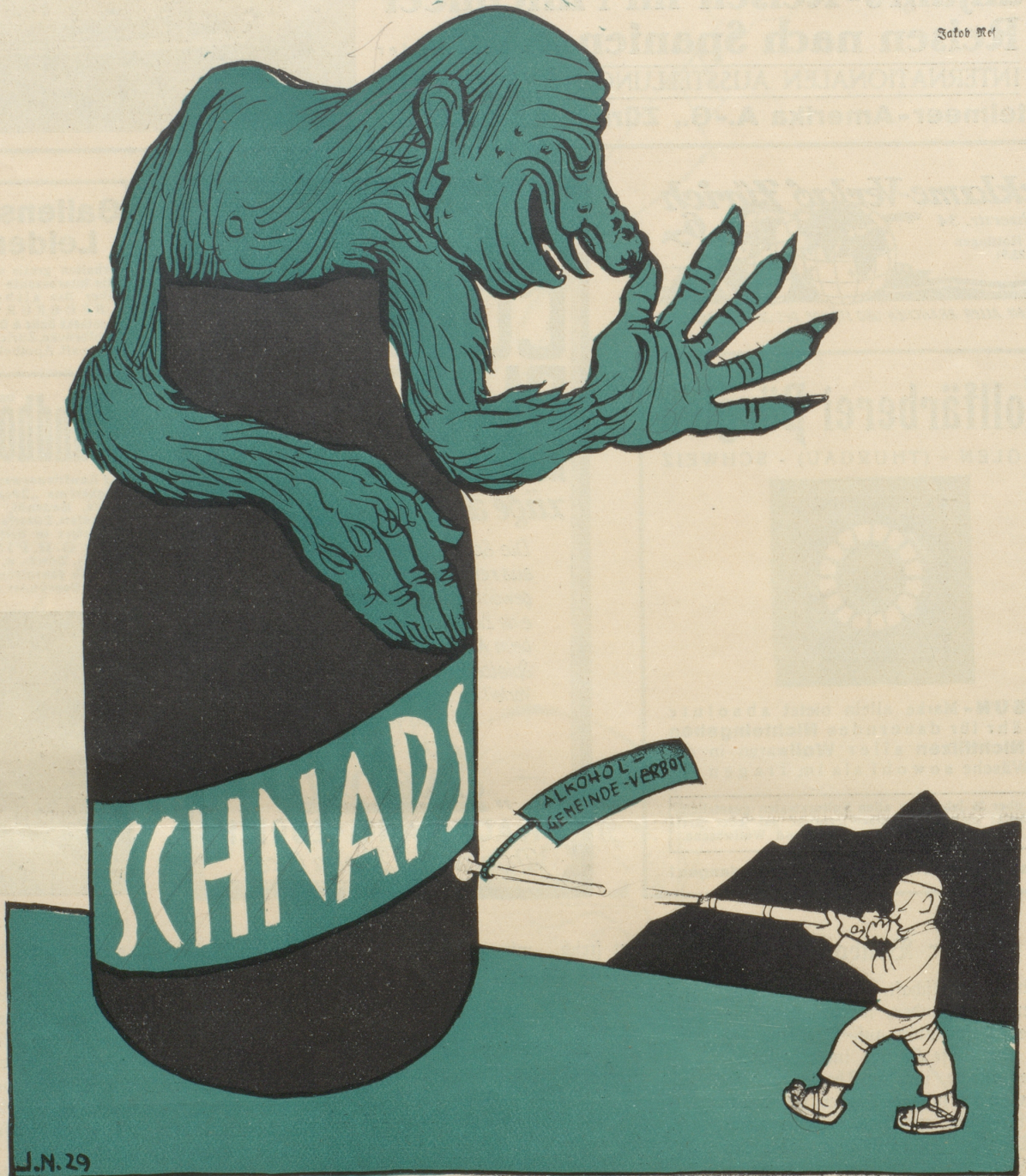
„Bei Ghline, mit derigem Spielzüg muescht nüd afange, das macht mer gwöß nüt.“