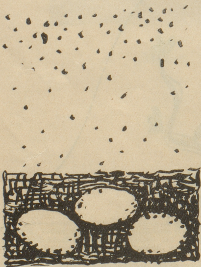
und wenn sie dann gehen?