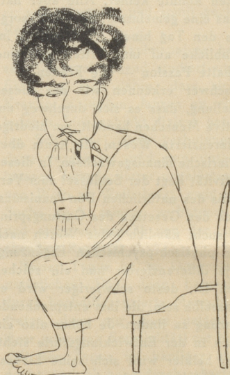
VII. Preis: Emmy Oesch, Amriswil