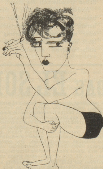
X. Preis: H. Witmer, Zürich

Café-Restaurant Brasserie Bürgerhaus Bern Sorgfältige Küche Ausgezeichnete In- u. Ausländische Weine u. Biere