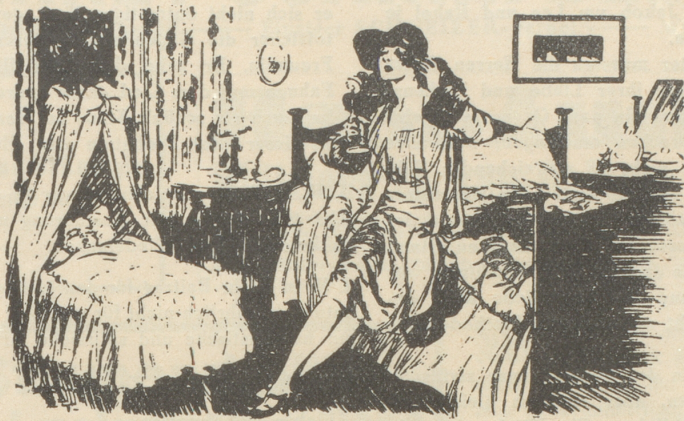
Die gute Mutter

„Hallo, ist dort der Telephondienst? — Hören Sie zu! Ich lege meinen Hörer in Baby's Bett. Wenn Baby schreit, rufen Sie mich bitte im Rommey-Klub an!“