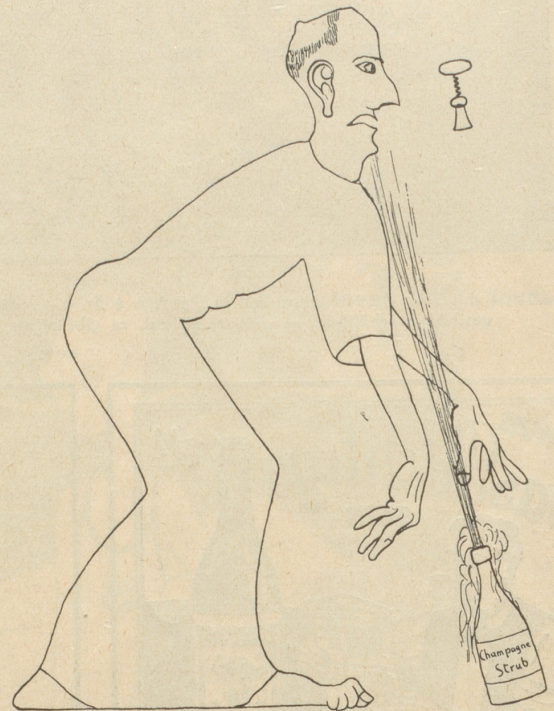
Das Verhängnis eines Abstinenten.