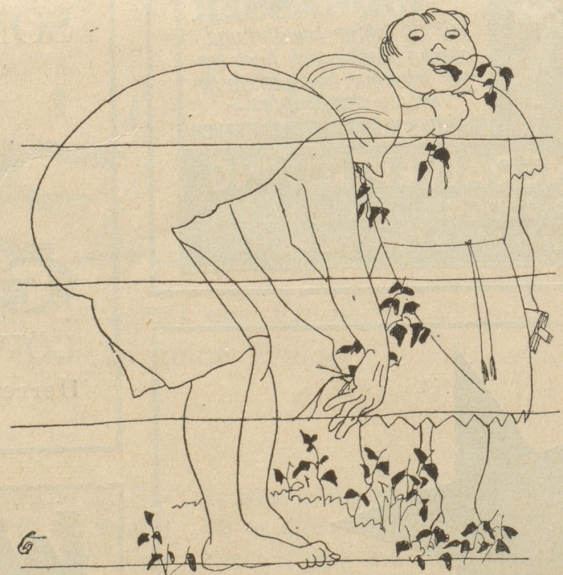
Rohköstlerinnen auf ihrem Weideplatz.

Das „G. L.“ vom 8. Juli berichtet: „Biel. Die Eisenbahnbrücke im Tauben- loch ist nun in der Nacht zum Freitag