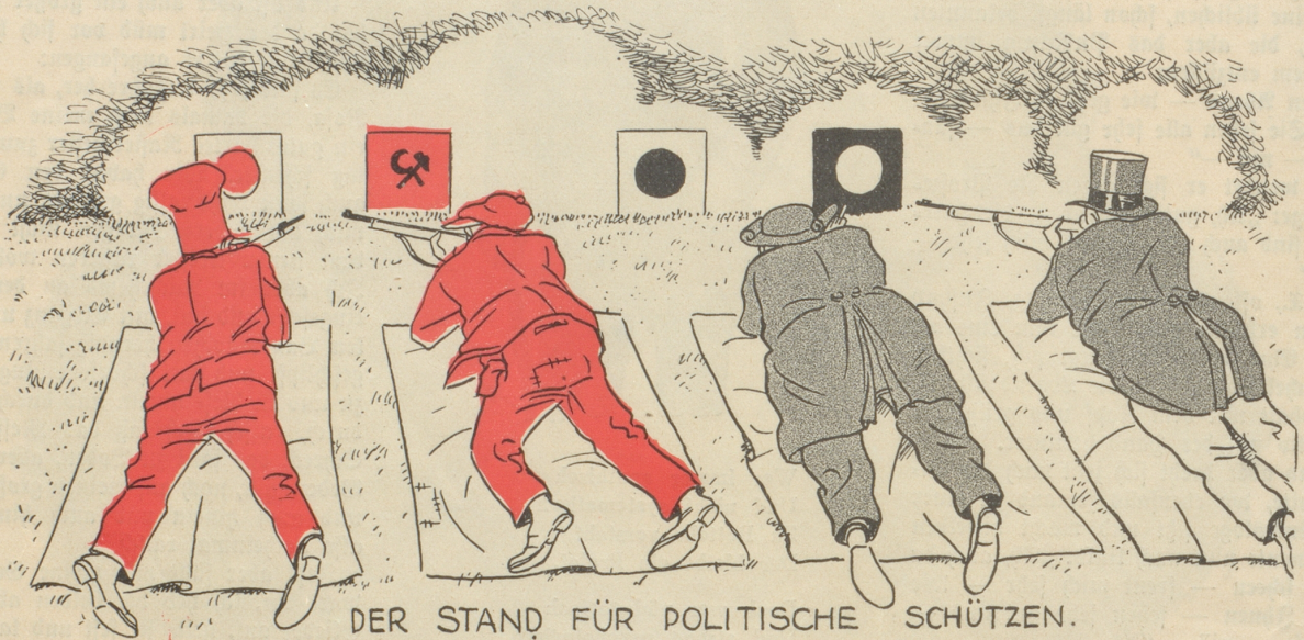
DER STAND FÜR POLITISCHE SCHÜTZEN.