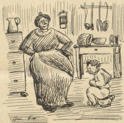
„Heiri gib Gas!“