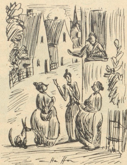
„Es tät's, wenn ä nu ein Uspuff offe wär!“