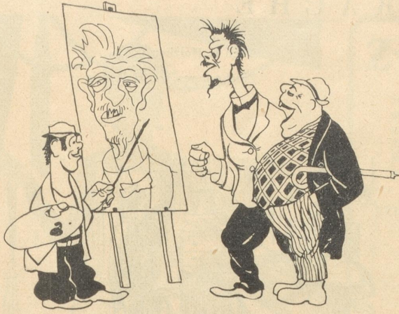
Schön ist es, wenn Malers Stift Deines Nachbars Schnute trifft.