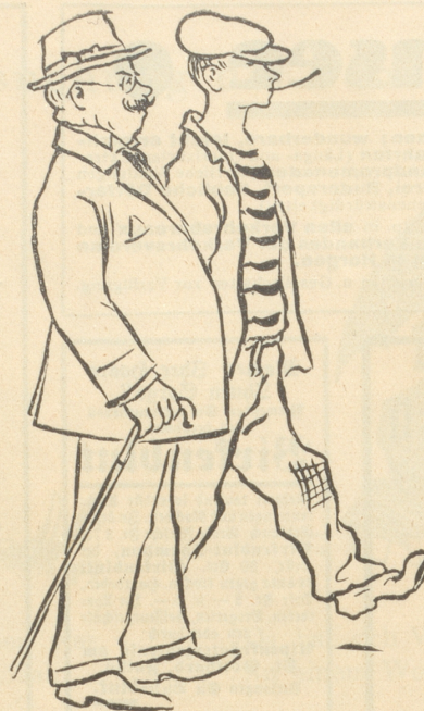
„Kleider machen Leute“ . . .

„Um den unumgänglichen Verpflichtungen nachzukommen, war ich genötigt, 4—5 Banketten beizuwohnen.“ (Sonderbarer Eid-