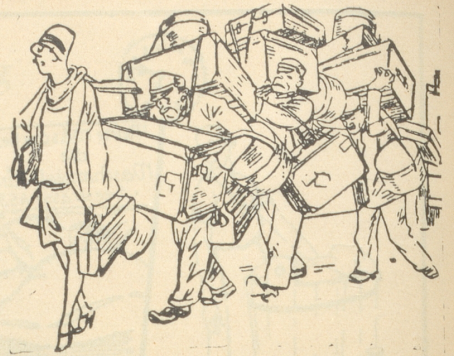
Ihr Gepäck auf der Fahrt ins Seebad

Verhagelt Rebekka dir tüchtig das Kraut, So hast du eine rasende Jüdin geschaut.