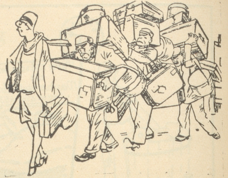
Ihr Gepäck auf der Fahrt ins Seebad

Verhagelt Rebekka dir tüchtig das Kraut, So hast du eine rasende Jüdin geschaut.