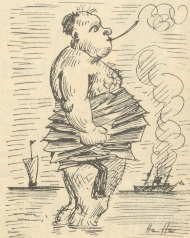
Warum denn nicht die Wadenbinden Sich um den Bauch beim Baden winden.

mit Garibaldi-Ring LA NATIONALE, Chiasso