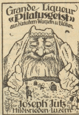
Der Liqueurkenner trinkt nur noch „Pilatusgeist“.

Doktonwerk Mörschwil (St. Gallen). Spezialfabrikate: Metall-Trockenputztücher „Dokton“ (Qualitäts-Erzeugnisse von Weltruf!) Fingernagelpoliertuch „Hexod“