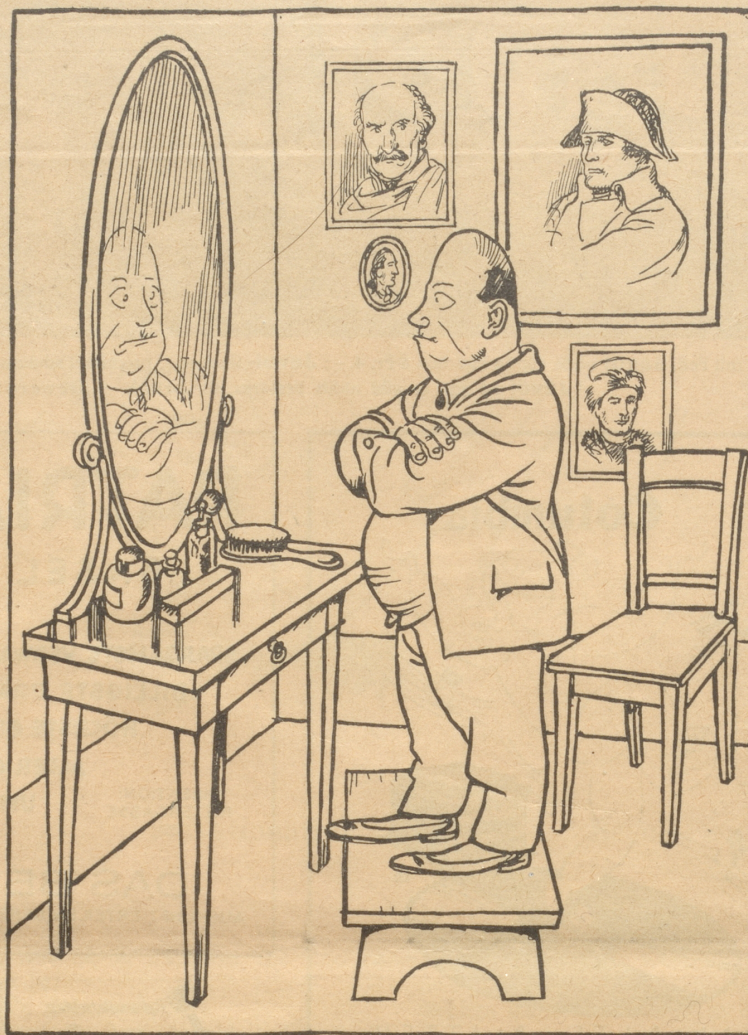
„Verzweifle nicht bei den Schwierigkeiten ein großer Mann zu werden.“

Tugbury Old Hall liegt abgelegen — acht Kilometer von jedweden Ort entfernt. Am Bahnhof war kein Fuhrwerk zu finden, so blieb mir nichts übrig, als zu gehen und meinen Handkoffer zu tragen. Es war fast dunkel, als ich mein Ziel, ein sehr großes Haus inmitten eines ausgedehnten Parkes, erreichte. Ich möchte sagen, daß dies Haus alle möglichen Zeitalter und Stilarten in sich vereinigt. Die halb aus Holzfachwerk bestehende Bauart der Elisabethianischen Zeit, verbunden mit dem Säulenbaustil der Vie-