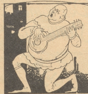
Pazifistische Serenade. Troubadour Grefemann: „Dieses verstimmte Instrument (Reichswehr) verdirbt mir alle Effette.“ (Rotenkrater, Amsterdam)

Mutter zum Söhnchen: „Wer hat die ganze Schokolade aufgeessen, die man mir zu Weihnachten schenkte?“