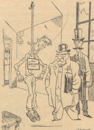
(Verzweifelter Steuerzahler erhängt sich, weil er dem Staate 6000 Kr. Steuern nicht zahlen kann.) ... Wir hätten ihm nicht so viel lassen sollen, daß er sich noch einen Strick kaufen konnte.“ (Le Rire)