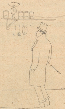
Im Duse! Ich kann heimkommen wenn ich will, es ist immer Mitternacht.