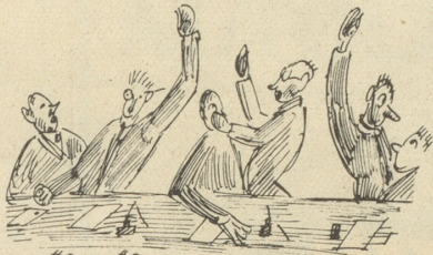
... zu schädigen und über's Ohr zu hauen.

zu Kontinent kennt keine Hindernisse und wickelt sich daher riesig schnell ab. Der vervielfachte Umsatz verbilligt alles. Große Erleichterung verschafft auch gleiches Maß und Gewicht auf der ganzen Erde.