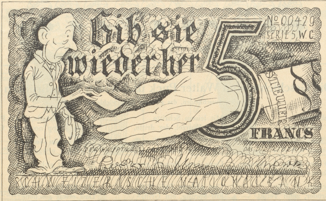
Ein weiterer Vorschlag des „Nebelspalter“ für eine neue Fünffrankennote.