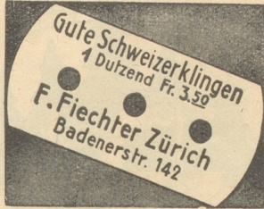
87) Nachnahme-Versand: 1/4 Dutzend Fr. 3.50, 1/2 Dutzend Fr. 1.80

Anlässlich eines Landankaufes in Basel las man in einer dortigen Zeitung: Wozu soll wohl dieser Landankauf dienen? Immerhin dürfte die in der Luft liegende Dreirosenbrücke dabei die Hände im Spiel haben. — Das scheint eine etwas unsichere Brücke zu sein, die in der Luft liegt und außerdem noch die Hände in Bodenspekulationen steckt.