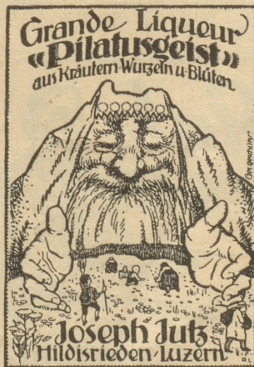
Der Liqueurkenner trinkt nur noch „Pilatusgeist“.

Übermüdung, Abspannung, Überreizung verlieren sich nach einer