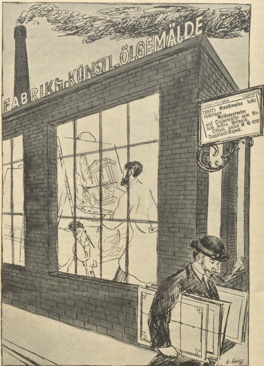
Nach zeitgemäßem Zeitungsinserat.