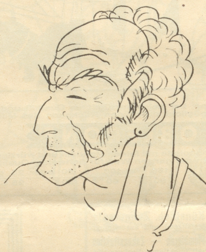
Sein Hauswirt Dörig von Appenzell

„Das ist auch gar nicht nötig. Tun Sie ganz einfach, was ich Ihnen sage. Alles andere überlassen Sie mir.“