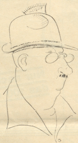
Der Sportsmann Pfeife aus Berlin