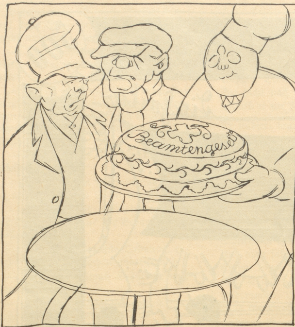
Der bürgerliche Zuckerbäcker setzt dem Sozi und dem Kommunisten eine schöne Torte vor.