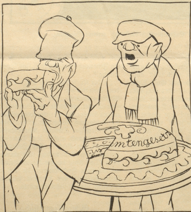
Nachdem er genügend geschimpft und geheßt hat, ißt er den Kuchen doch.