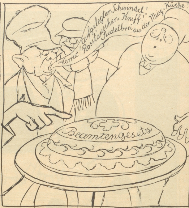
Der Sozi bedankt sich aufs „Liebenswürdigste“.