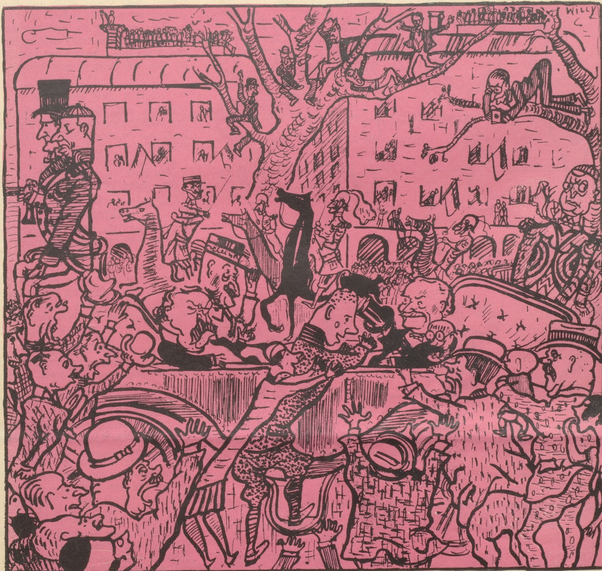
Der erst siebenjährige Charly Kurzhoser entwich per Avion aus dem Elternhaus. Begeisterter Empfang in Paris.

oder: Wer einmal Rekorde treiben will, fliegt beizeiten.