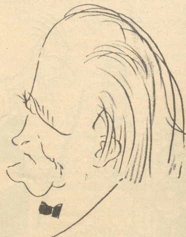
Der Mann der so fabelhafte Beethoven spielt.

Romont erfaßt und getötet. Seine Eltern bewohnen ein nahe dem Geleise gelegenes Bauernhaus, und der Kleine spielte auf demselben, als der Zug herankam. — Wenn also der Knabe auf dem Bauernhaus spielte und dabei unter die Räder des Zuges kam, dann fährt, was eigentlich bisher nicht bekannt war, der Zug Bulle-Romont geradewegs über das Haus der Eltern des armen Bubleins hinweg. Dann hätte man es aber auch nicht auf dem Haus spielen lassen dürfen.