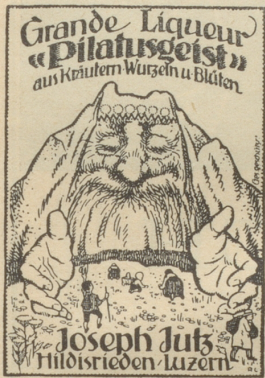
Der Liqueurkenner trinkt nur noch „Pilatusgeist“.

Von dem verstorbenen Sovietbotschafter Krassin hört man, daß er nicht weniger als 3 Millionen Pfund Sterling gleich rund 75 Millionen Franken hinterlassen hat. Da ist es nicht zu verwundern, daß die Bolschewikenregierung für einen so tüchtigen Gefinnungsgegnossen eine 14-tägige Landestrauer angeordnet hat. Daß hat er wirklich verdient, besonders wenn man in Betracht zieht, daß das Vermögen ausschließlich im Auslande angelegt ist. — Sothario