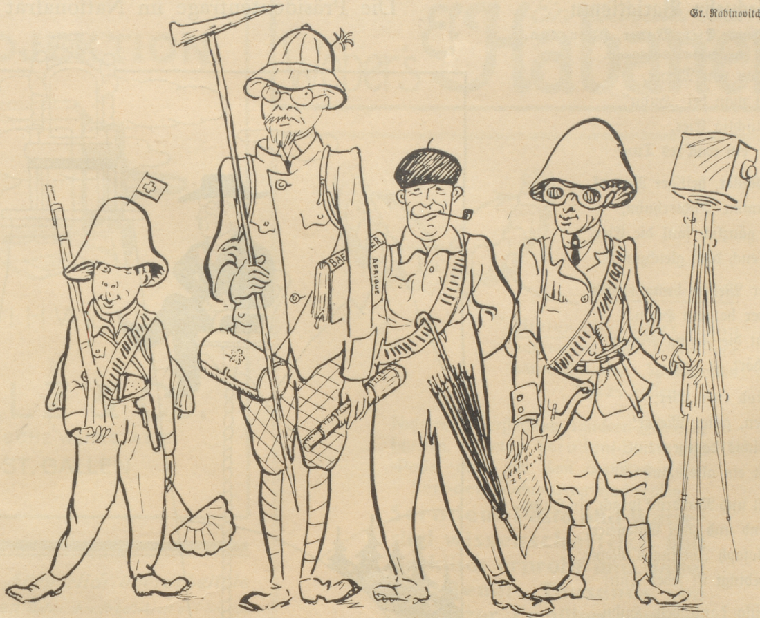
Die Expeditionsteilnehmer sind flugbereit und machen einen äußerst seriösen Eindruck.

nötige Abkühlung. Eine spezielle kunstförmige Einrichtung am Schwanz des „Switzerland“ dient zum Löwenfang. — Das Flugzeug und die vier tapferen Expeditionsteilnehmer machen einen äußerst seriösen Eindruck. Wie die „Aero-Revue“ mitteilt, wird, um allfälligen Überraschungen gewachsen zu sein, ein Maschinengewehr der schweizerischen Armee mitgeführt.