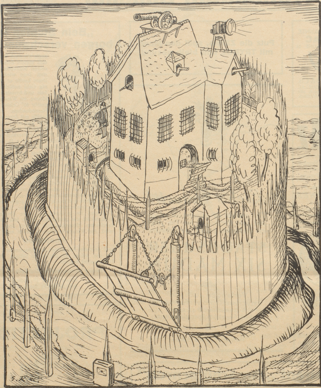
Ein Vorschlag an die Basler Villen-Besitzer, die den Tod eines Securital-Wächters nicht auf dem Gewissen haben wollen.