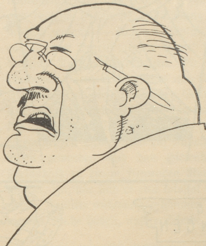
Der Mann hinter dem Schalter

Abjaß ihres Schuhs an meinem Hosenbein hängen geblieben und im Fallen den Fuß gebrochen hatte. Vergeblich machte ich geltend, daß es ihre eigene Schuld gewesen sein mußte, weil sie vermutlich nicht richtig tanzen konnte . . . man hörte nicht auf mich und ehe ich's mich richtig verfaß, lag ich draußen vor der Türe . . . Ich mußte betrübt erkennen, daß auch hier