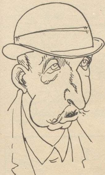
Der Mann vor dem Schalter