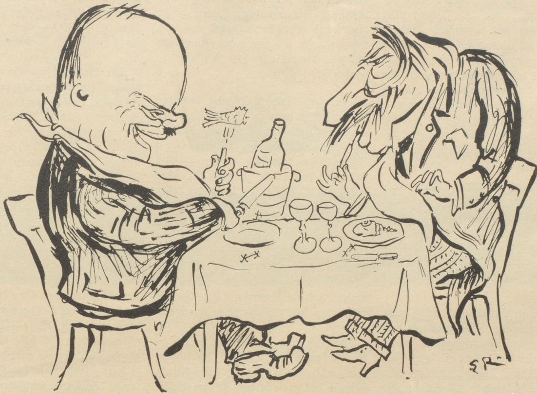
„Die Liebe geht durch den Magen“

für das große Unternehmen gründlich vorbereitet.“ So las man in der Zeitung über Gertrud Ederle. Merkwürdig ist nur, daß andere Mütter noch weit mehr als zwei Kinder gestillt haben und trotzdem nicht einen Meter weit schwimmen kön-