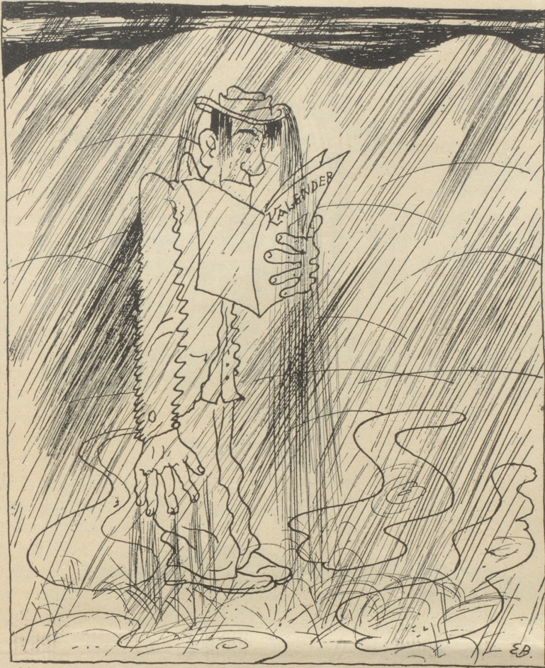
Wenn das Wasser vom Hute fließt, ist es ein Zeichen, daß es gießt.