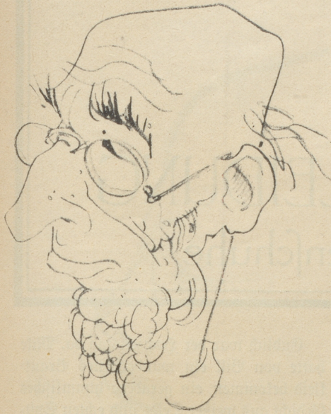
Der Vegetarier Hürzeler

Vorstand des „Vereins gegen Fleischfresserei“