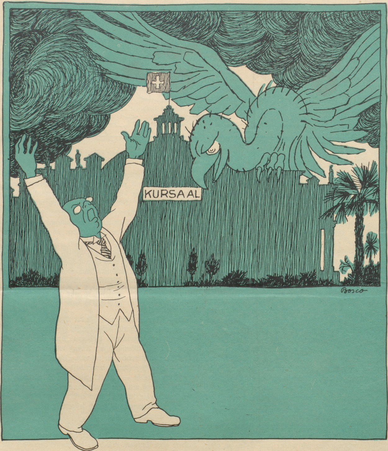
„Ein Königreich für ein „Rössi“!“

professoren, knüpfte mit vier geborenen Engländerinnen zarte Verhältnisse an, entließ meine Stenographistin und ersetzte sie durch ein Mitglied eines Damenfußballklubs — alles umsonst. Kein Mensch wußte zuverlässige Auskunft, ob „der“ oder „das“! — Als ich es in Sportskreisen bereits zu einer gewissen, anrühmigen Berühmtheit gebracht hatte, knüpfte ich mir als ultima ratio meinen jüngsten Stift vor, von dem ich wußte, daß er in Fußballsachen besser Bescheid wußte, als in der mancolosen Führung der Portokasse. Unter Anwendung aller erdenklichen Listen zwecks Wahrung meiner Autorität legte ich ihm die ominöse Frage vor und