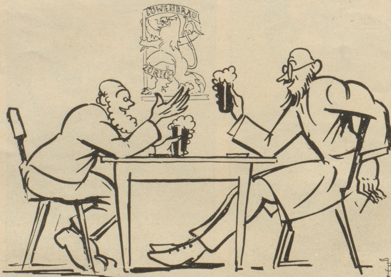
Dhni „Zürcher Löwenbräu“ würd is kein Tag meh ushalte, Herr Dokter!

Der Schwimmklub St. Gallen hat kürzlich einen Tanzaabend ver-